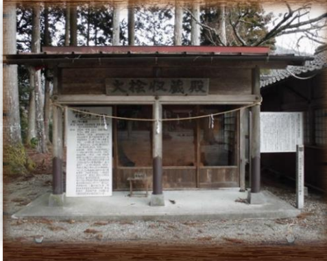
②大ヒノキ年輪板 (護山神社内)