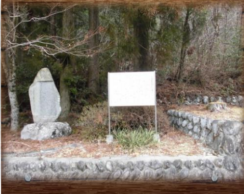
①王滝新道跡 (1区大起林道入口)