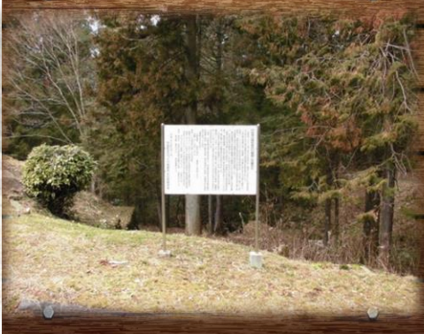
⑦荏菹用水 (5区広谷橋南側)