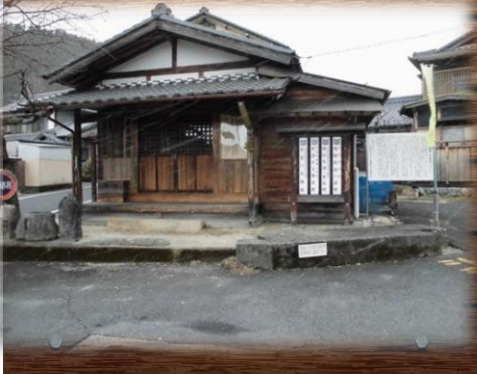
⑤倉屋観音堂 (倉屋観音堂・辻堂)