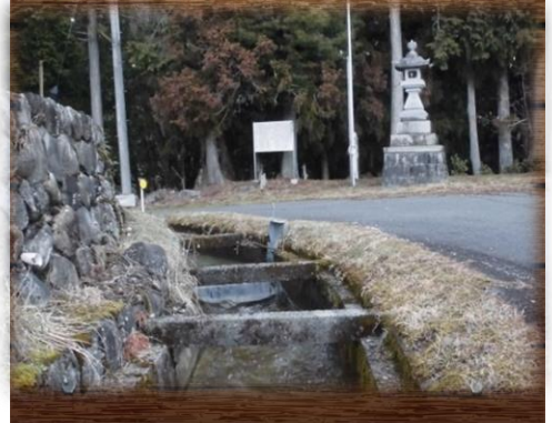
③西股用水 (護山神社入口)