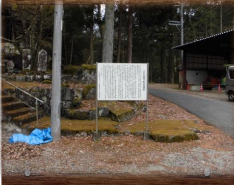
⑧大右衛門新道 (8区稻荷集会場南側)