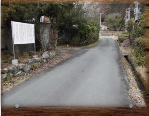
④飛騨街道 (2区上倉屋から馬瀬池へ通じる市道)