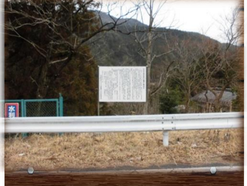
⑥鱒淵用水 (3区塔/岩橋西側)