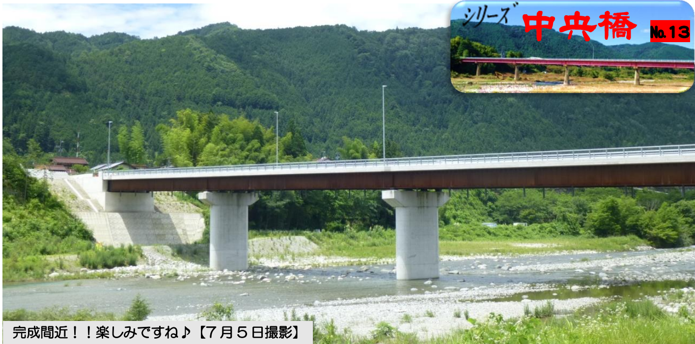
完成間近！！楽しみです！【7月5日撮影】