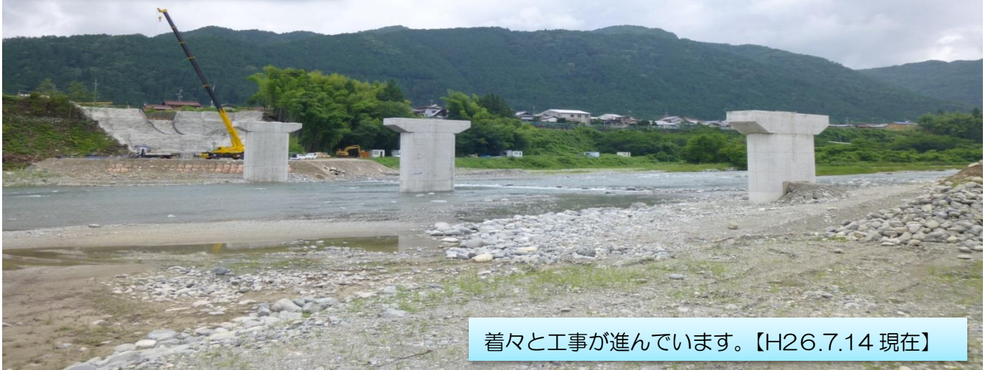
着々と工事が進んでいます。【H26.7.14 現在】