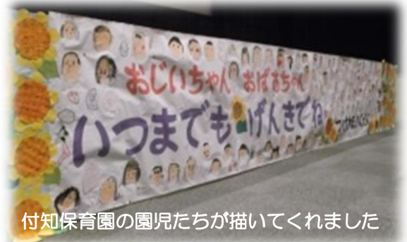
付知保育園の園児たちが描いてくれました