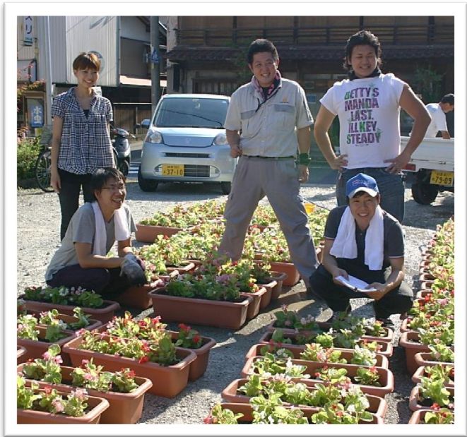
花植えをする付知GINZA会の皆さん