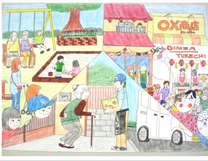
紙芝居②枚目 行政に望む事、自分達ができる事