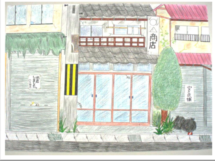
紙芝居①枚目 自分達の身近な問題