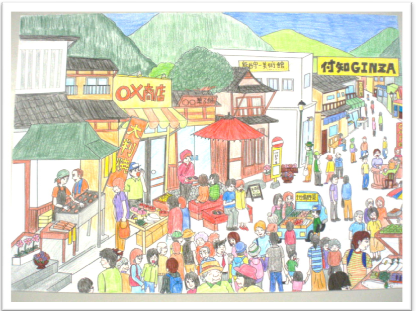
紙芝居③枚目 自分達が望む付知町の将来