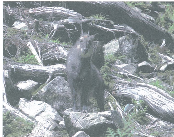
▲御神木伐採跡地ではカモシカの出迎え