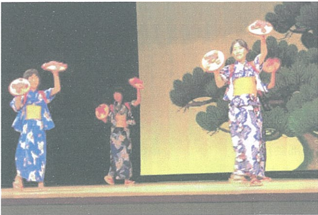
▲浴衣をきて丁寧に踊る子供たち

優しい歌声、すばらしい踊り、華やかな踊り、子供の愛らしい仕草と表情に、思わず笑みもこぼれ、特に参加者も口ずさむことのできる唱歌を出演者と共に皆で歌い昔のなつかしさを思いだし、声をはりあげ嬉しそうな姿が印象的でした。