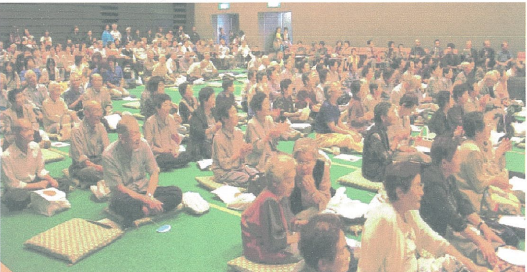
▲みなさん和やかでいいお顔をしていますね

また、旅館食堂組合のご協力により、美味しい弁当が振る舞われ、食事を摂りながらの世間話、想い出話にも花が咲き、たいへん楽しい一時を過ごしていただくことができました。少子高齢社会、核家族化が進む中で、安心して暮らせる地域を目指していくためには、地域住民の果たす役割は重要となってきました。