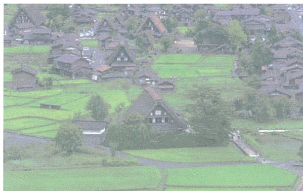
▲白川郷はどこかつかし気持ちになりますね!

日・時 平成20年10月27日(月)19時~ 場 所 アートピア付知交芸プラザ「ホール」 問い合わせ 付知総合事務所企画振興課 ☎82-2111(内線3433)